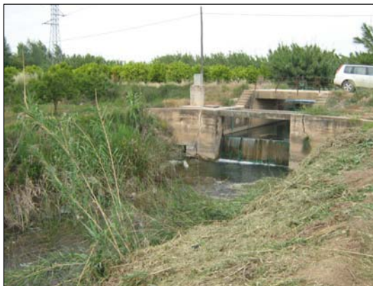
Foto 1: Efecto barrera de la compuerta para derivación de agua de riego en el nacimiento del río Verde

Por lo que se refiere a la fauna ictícola, destaca la presencia en el río Verde de ejemplares de Samaruc ( Valencia hispanica ), así como de una población importante de colmilleja ( Cobitis paludica ), tanto en el nacimiento como en el cauce del río Verde. Ambas son especies de reducido tamaño, pudiendo considerarse como especies litorales de corto recorrido con baja capacidad para superar obstáculos. Según el Protocolo para la valoración de la calidad hidromorfológica de los ríos, este grupo de peces tiene una capacidad de salto sobre barreras verticales